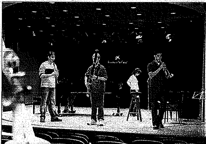
Los músicos aspiran a una de las 90 plazas de la nueva orquesta.