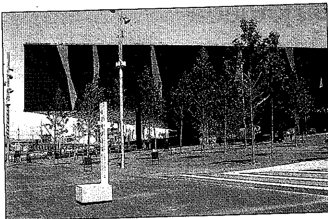
Edificio principal del Fórum donde se celebrarán distintos actos culturales.

ENCUENTRO Durante este festival, que se presenta como una metáfora de un mundo que debe convivir en un contexto de diversidad, y que dura 141 días, hay lugar para artistas e intelectuales de todos los continentes • La cultura balear aporta algunos de sus creadores en distintos campos